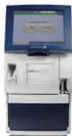
血液ガス分析装置 ABL 90 FLEX PLUS